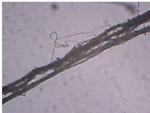
Fig.2 Filamento (100x)